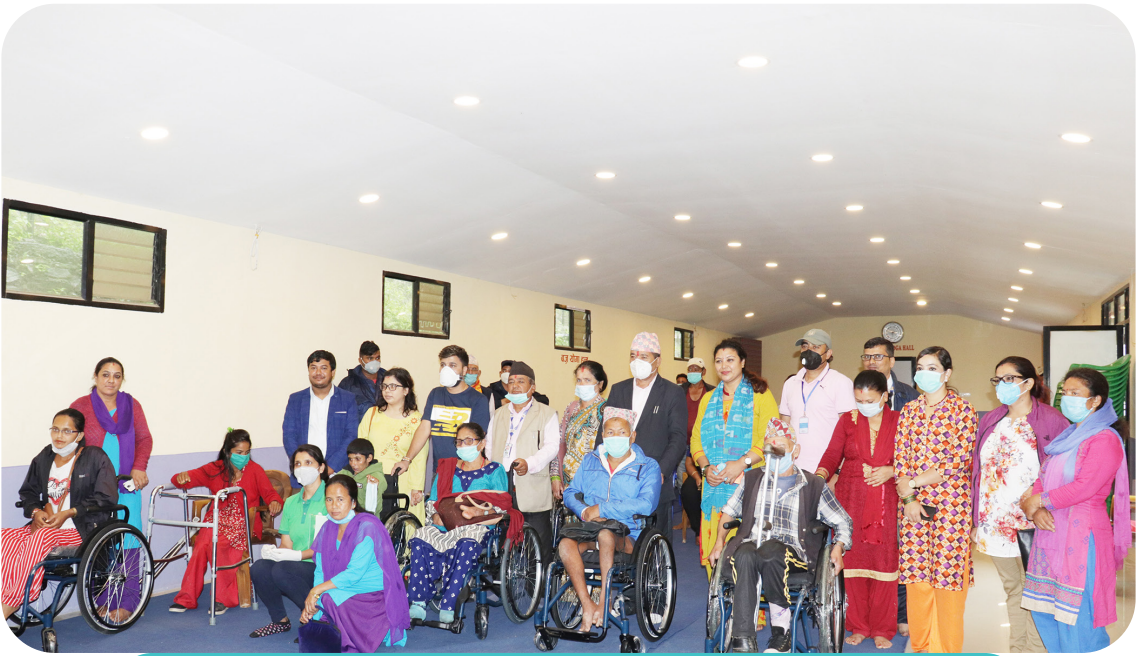
हुईलचेयर वितरण कार्यक्रम