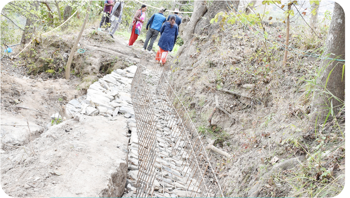
नगर स्तरीय योजना अन्तर्गत वडा नं ७ मा कुलो निर्माण