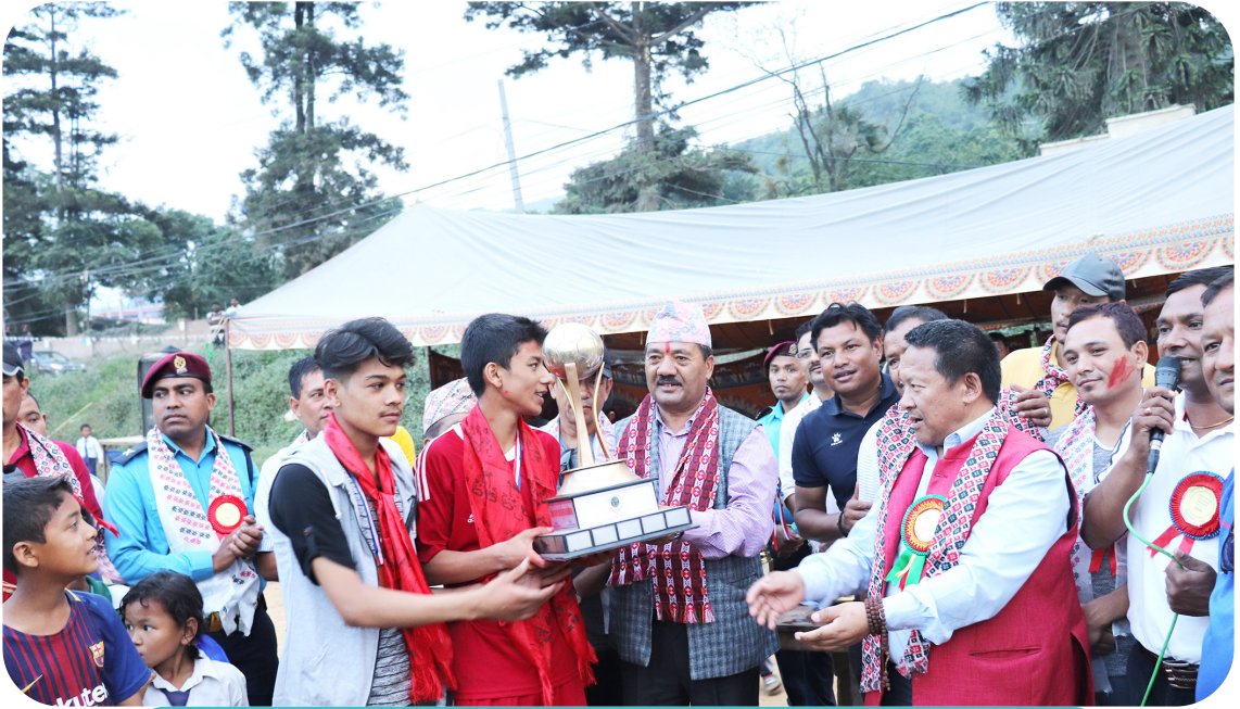
नगर स्तरीय अन्तर विद्यालय फुटबल प्रतियोगिता