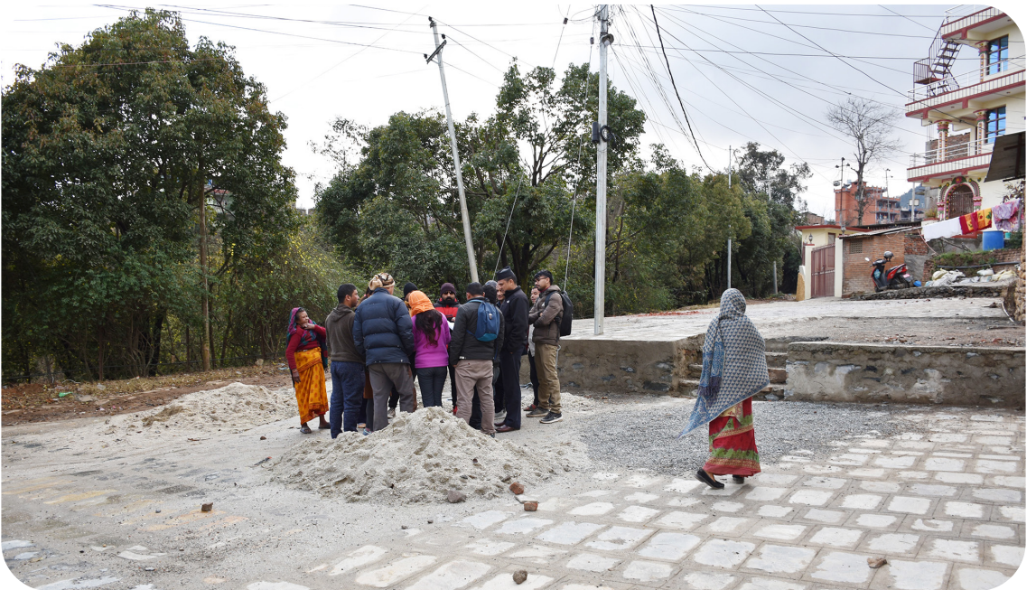
स्थानीय पूर्वाधार विकास साभेदारी कार्यक्रम अन्तर्गत वडा नं ५ को योजना