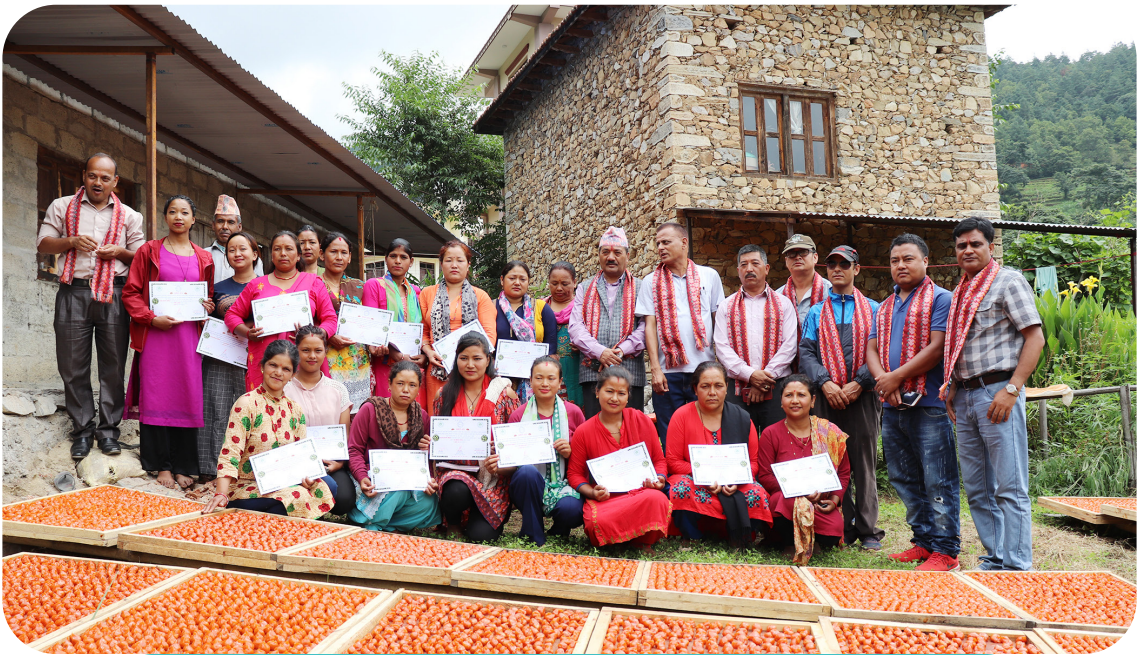
लप्सीको क्यान्डी उत्पादन सम्बन्धी तालिम