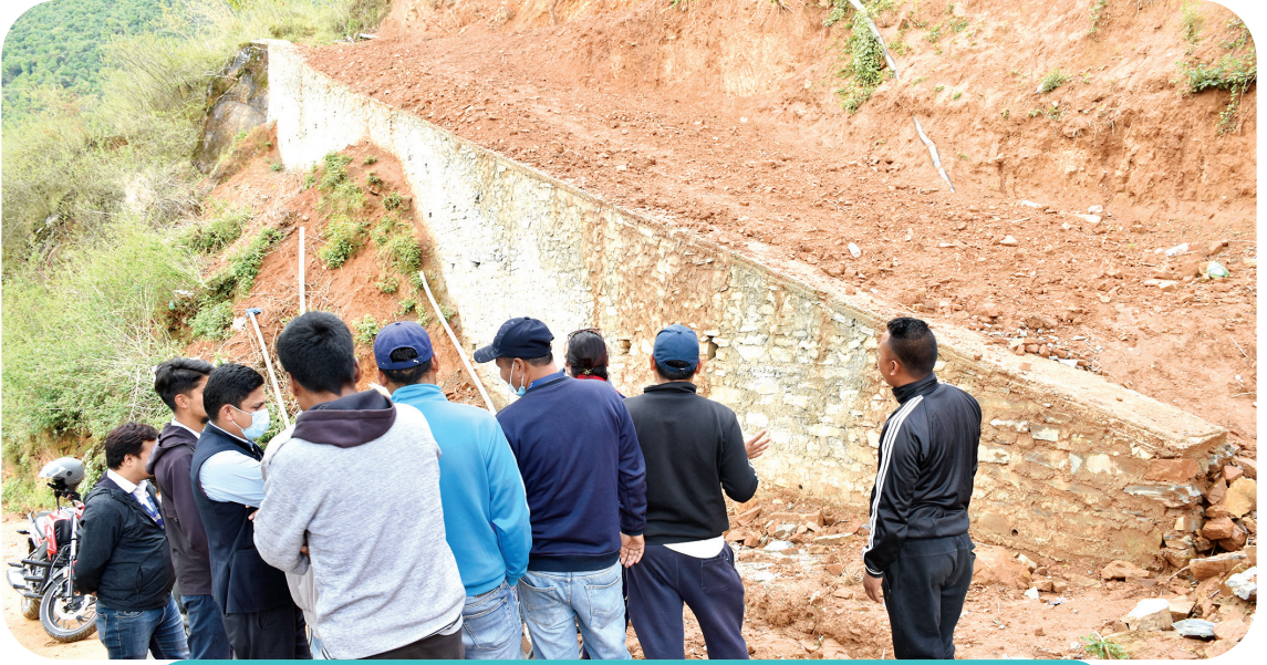
दक्षिणकाली नगरपालिका वडा नं १ मा बाटो तथा पर्खाल निर्माण