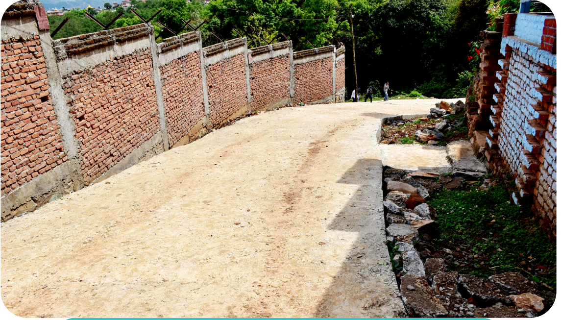
नगर स्तरीय योजना अन्तर्गत वडा नं ५ मा शान्तिवन वाटिकाको बाटो निर्माण