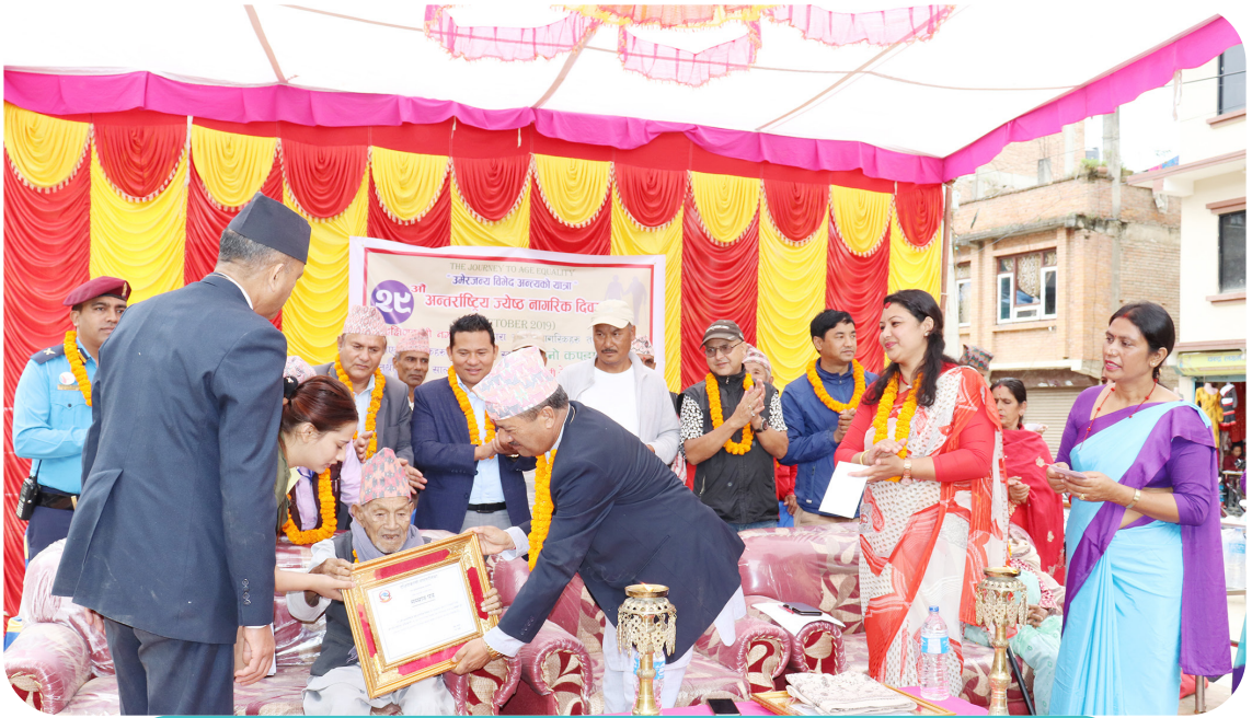
जेष्ठ नागरिक सम्मान कार्यक्रम