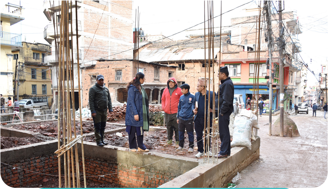
नगर स्तरीय योजना अन्तर्गत वडा नं ६ मा रहेको पंचायत भवन निर्माण