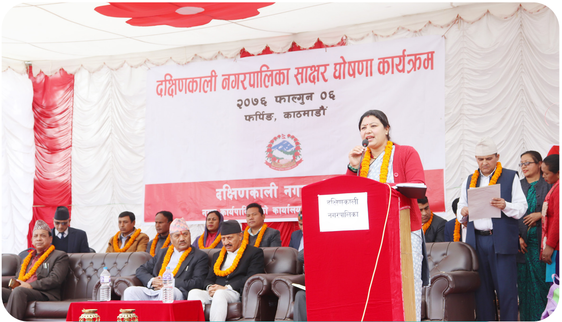
दक्षिणकाली नगरपालिका साक्षर घोषणा कार्यक्रम