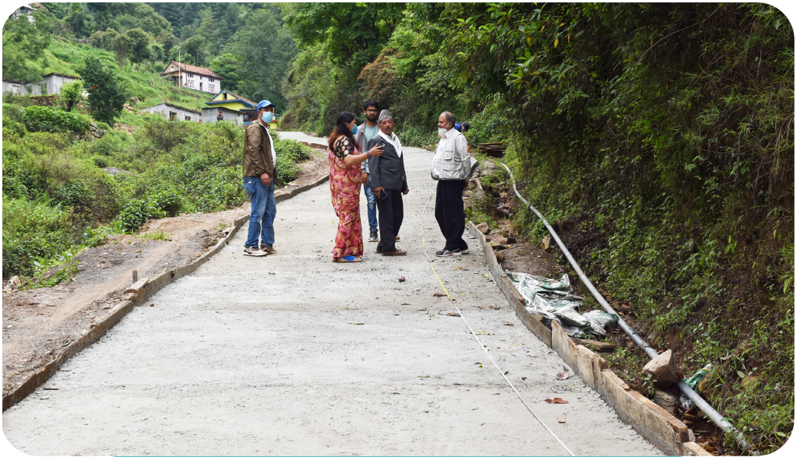
दक्षिणकाली नगरपालिका वडा नं ९ मा बाटो ढलान