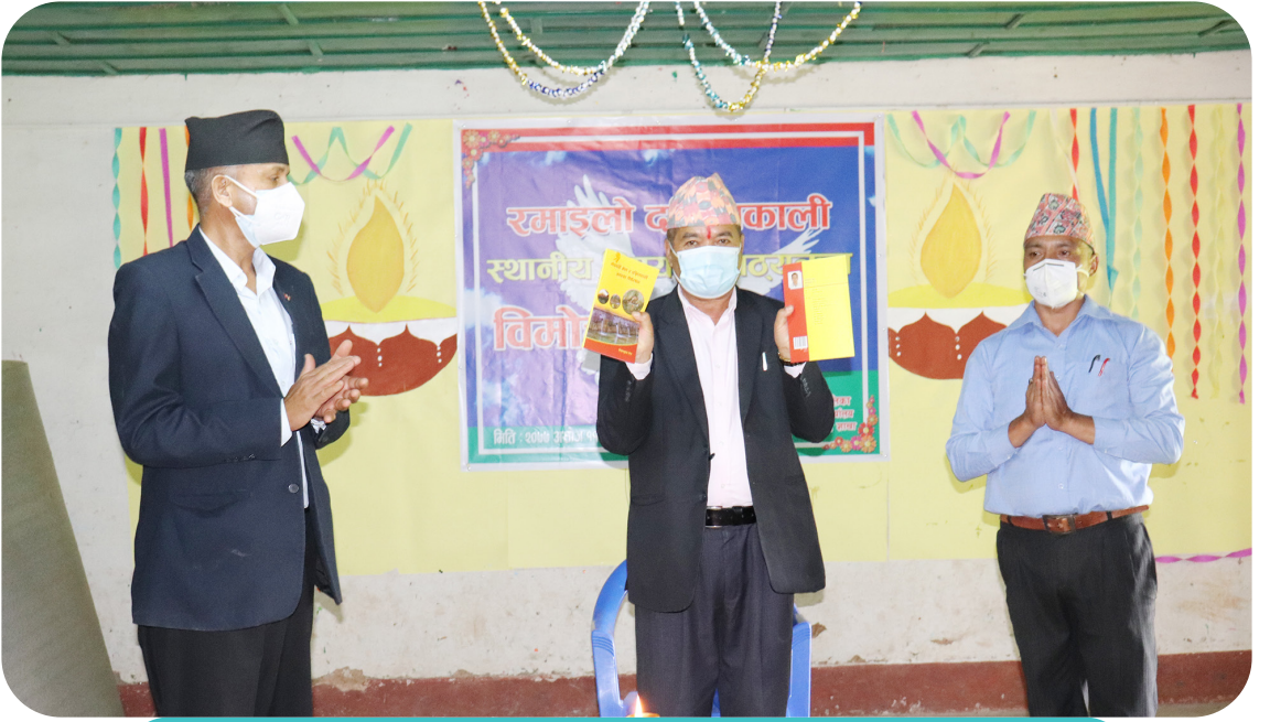
स्थानिय पाठ्यक्रम रमाइलो दक्षिणकाली विमोचन कार्यक्रम